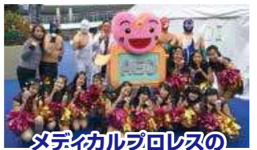
メディカルプロレスの 皆さんとN☆JEWEL