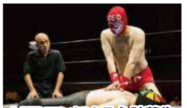
AEDマンによる心肺蘇生